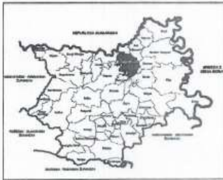
Položaj Općine u Osječko-baranjskoj županiji

Općina Jagodnjak formirana je 1997. godine i utemeljena Zakonom o izmjenama i dopunama Zakona o područjima županija, gradova i općina u Republici Hrvatskoj („Narodne novine“ broj 68/98) a u okviru sadašnjih granica formirana je Zakonom o izmjeni i dopuni Zakona o područjima županija, gradova i općina u Republici Hrvatskoj („Narodne novine“ broj 79/02).